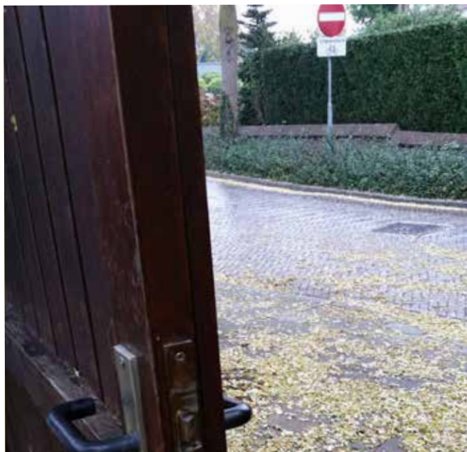
1DagNiet: geef inbreker geen kans

Op vrijdag 28 november trok er weer een inbraakpreventie-team door de wijken Stationsbuurt, Eshof en Westeraam. Net als andere jaren neemt de gemeente Overbetuwe deel aan de landelijke campagne '1DagNiet'. 's Middags liepen bewoners, politie en BOA's door de wijken Eshof en Stationsbuurt; er werden negen open auto's aangetroffen en vier open poorten, schuur- en garagedeuren, waarbij zelfs een deur met de sleutel er nog in. Op plekken, waarbij het preventieteam zich