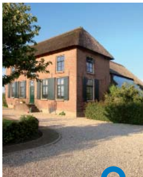
De Grote Bouwkamp