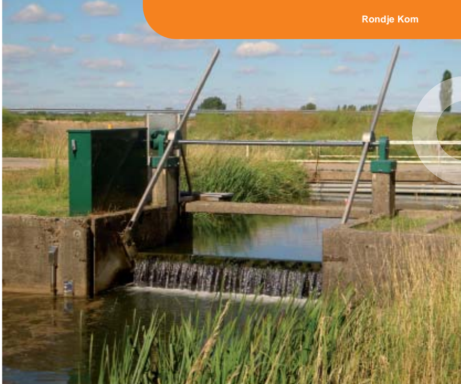
Stuwen regelen in het gebied het waterpeil