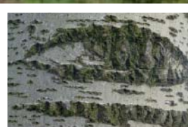
Rechts: Grijze schors van de abeel