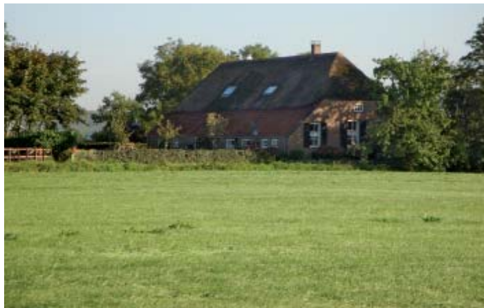
De Kleine Bouwkamp

De stroomrug van Homoet wordt al eeuwen bewoond. De oudste bewaard gebleven boerderijen zijn de Grote Bouwkamp en Kleine Bouwkamp. Ze liggen aan uw linkerkant, net na de brug, aan een weggetje het land in. De Kleine Bouwkamp is van het type 'hallenboerderij'. Het voorhuis en stal vormen één geheel. De Grote Bouwkamp, die verder naar achteren ligt, is een Betuwse 'T-boerderij'. Een voorhuis met loodrecht daarop geplaatst een schuur (T-vorm).