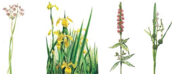
V.l.n.r zwanenbloem, gele lis, kattenstaart en grote egelskop

U ziet, afhankelijk van het moment van het jaar, een bloemenpracht langs de oevers van de watergangen. Er bloeien o.a. zwanenbloemen, gele lis, kattenstaart en grote egelskop.