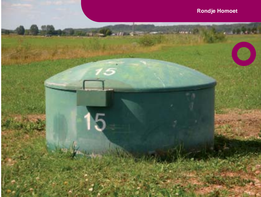
Waterwinput met op achtergrond stuwwal Veluwe