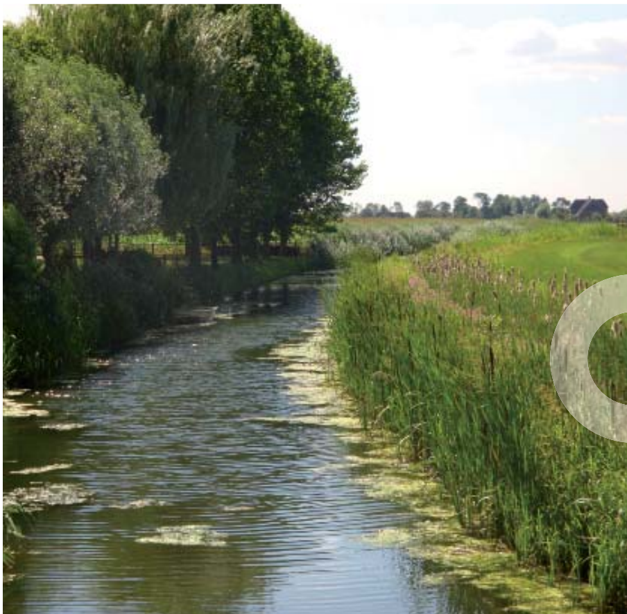
Natuurvriendelijke oever Eldensche Zeeg

Zeeg is een Betuwse naam voor een gegraven watergang.